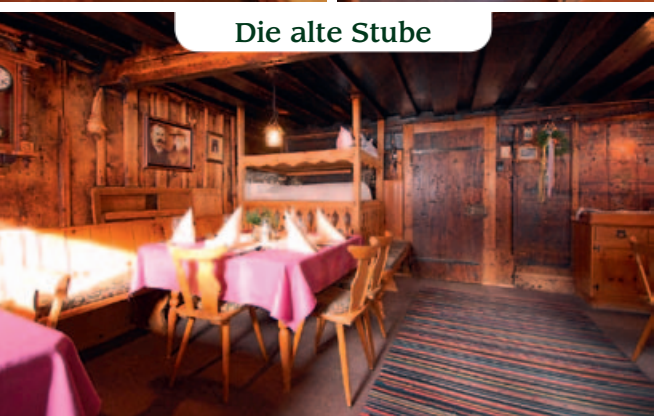
Die alte Stube