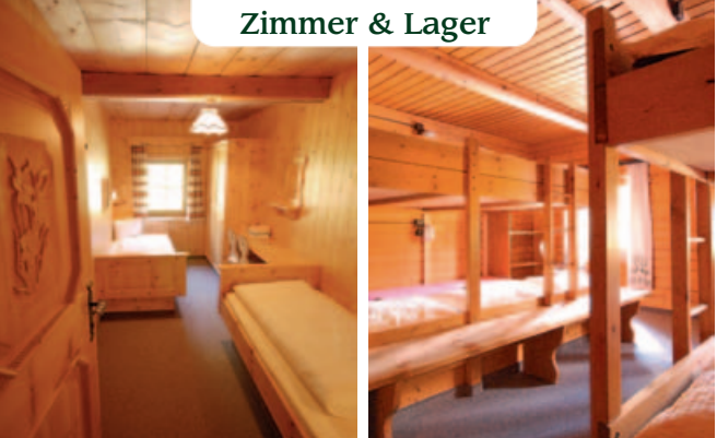
Zimmer & Lager