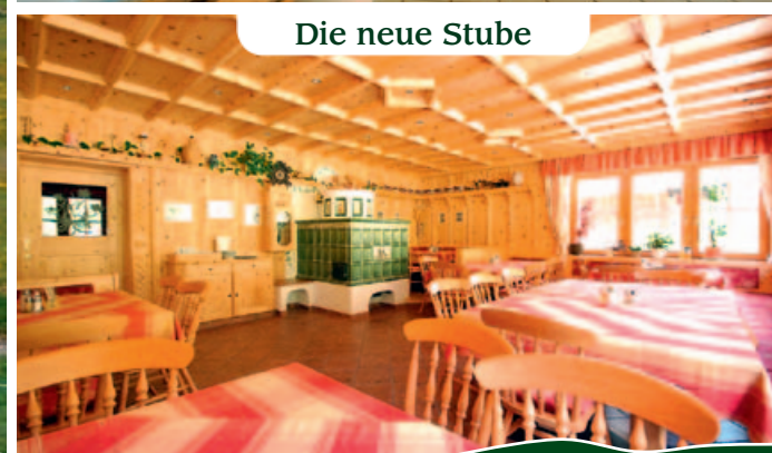
Die neue Stube