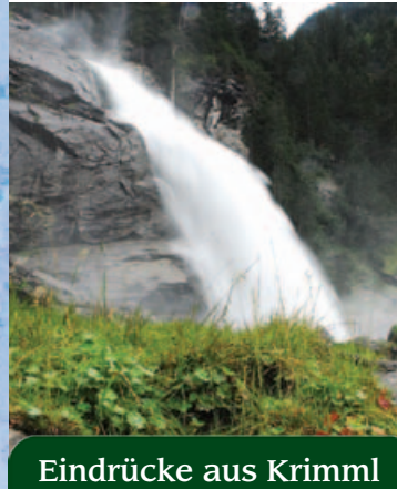
Eindrücke aus Krimml